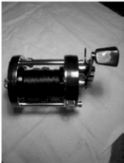
Rolle: Eine Multirolle ABU Ambassadeur 7000, einmal gebraucht CHF 60.--