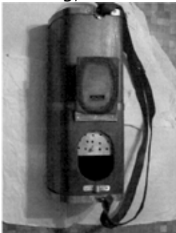
Fischbehälter Holz antik: Dem Meistbietenden